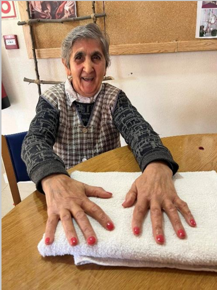
A cuidar das nossas senhoras no Dia da Mulher!